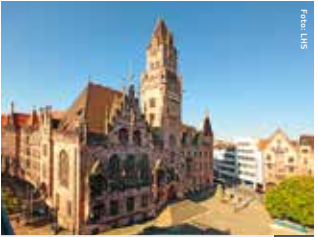
Rathaus St. Johann 3