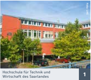
Hochschule für Technik und Wirtschaft des Saarlandes 1