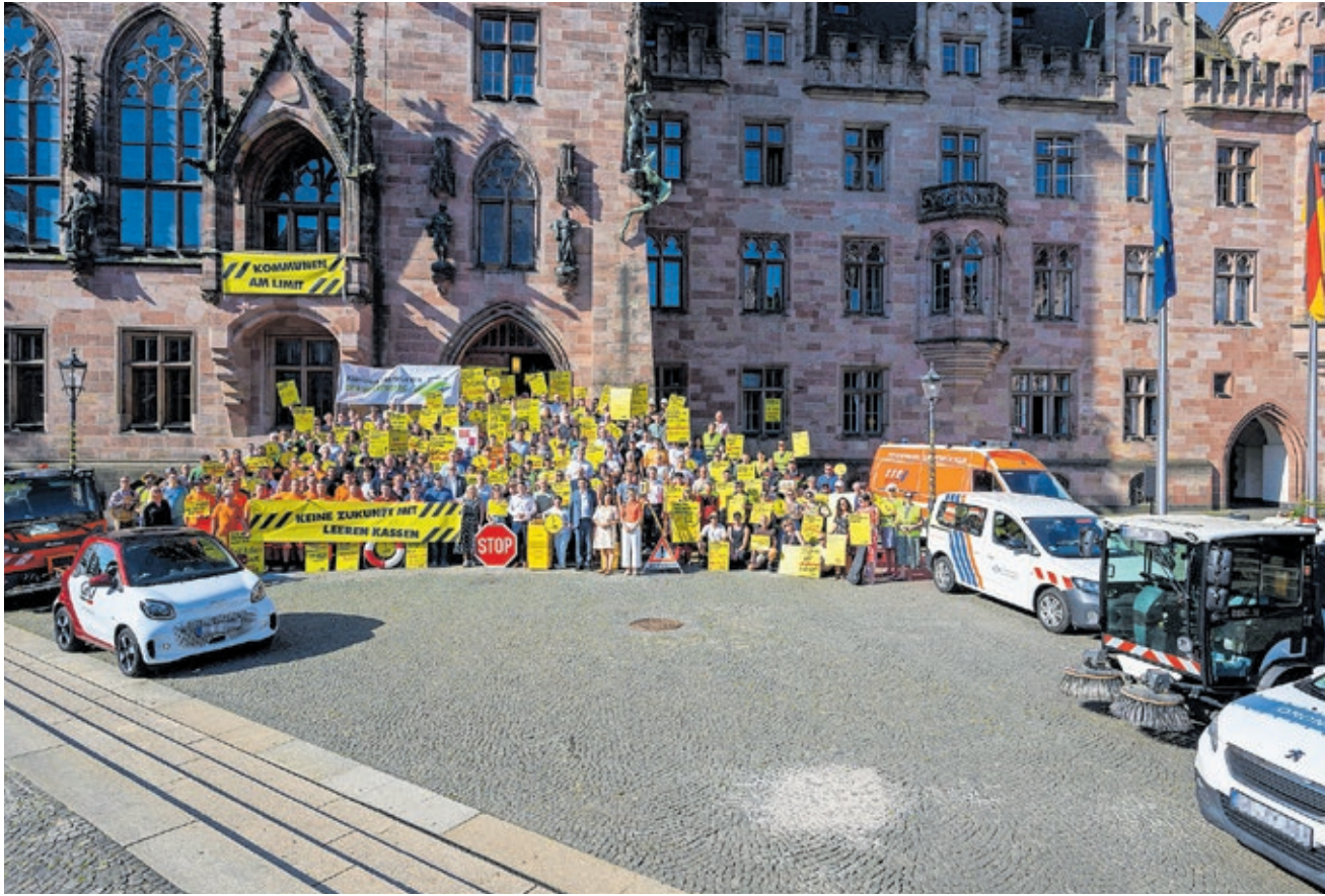
Mitarbeiterinnen und Mitarbeiter der Landeshauptstadt zum Aktionstag „Kommunen am Limit“.