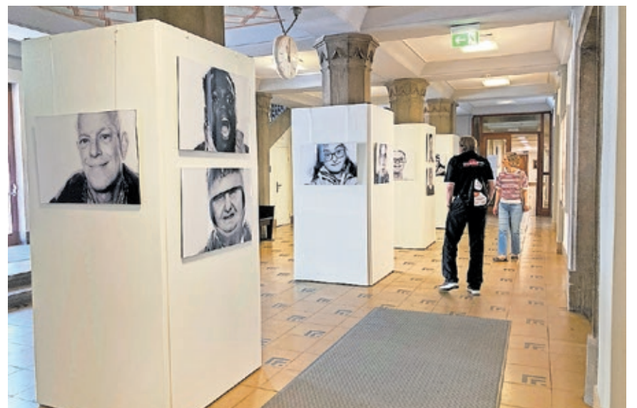
Die Ausstellung im Erdgeschoss des Rathauses St. Johann zeigt Porträts internationaler Athletinnen und Athleten mit geistiger Behinderung.

Der überwiegende Teil der Wettbewerbe wurde in Saarbrücken ausgetragen: Die Landeshauptstadt war zentraler Treffpunkt für Athletinnen und Athleten, Delegationen, Volunteers sowie Besucherinnen und Besucher aus dem gesamten Bundesgebiet. Zahlreiche Veranstaltungen in Saarbrücken begleiteten die Wettbewerbe und brachten Menschen mit und ohne Behinderung zusammen.