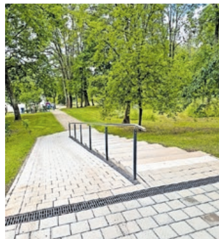
Eine Rampe an der Podesttreppe im „Obstgarten“ sorgt jetzt für mehr Barrierefreiheit.

Der „Obstgarten“ grenzt direkt an die Kita Eschberg und das Seniorenwohnstift Egon-Reinert-Haus an. Bei der Neugestaltung legte die Landeshauptstadt besonderen Wert auf Barrierefreiheit. Neue Zugänge, unter anderem vom Egon-Reinert-Haus und vom Saalepfad aus, ein nun asphaltierter Hauptweg für mehr Trittsicherheit und eine neue Rampe an der Podesttreppe ermöglichen auch Menschen mit eingeschränkter Mobilität einen sicheren Zugang zu der Anlage. Außerdem gibt es