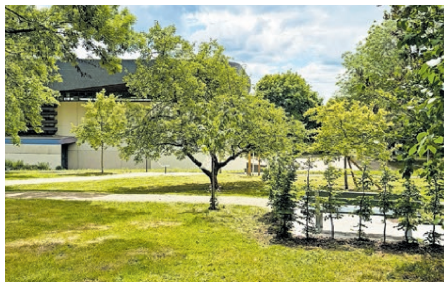
Neue Obstbäume und heimische Sträucher ergänzen den Baumbestand im „Obstgarten“.

eine neue Querverbindung in Form eines asphaltierten Weges im unteren Parkbereich.