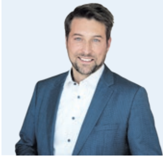
Uwe Conrads Oberbürgermeister der Landeshauptstadt Saarbrücken

Ich bin überzeugt: Saarbrücken gehört auf die Schnellzugachse zwischen Paris und Berlin – als Brücke zwischen zwei Ländern und als sichtbares Zeichen für ein starkes Europa.