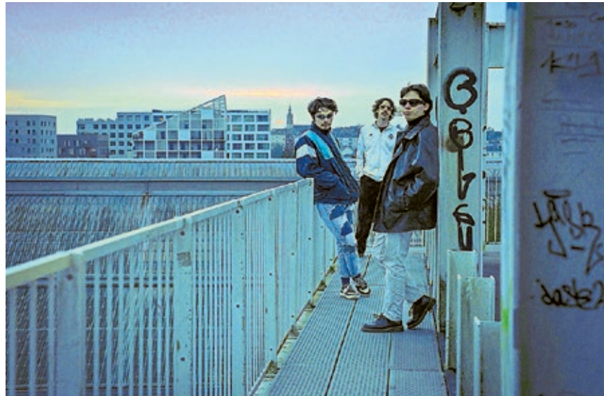
Die Nanteser Band „Doing Something Dangerous with Style“ ist beim Altstadtfest Teil des Programms auf der Rockwiese.

Juli, ab 20 Uhr auftritt. Die drei Musiker im Alter zwischen 20 und 30 haben sich seit ihrer Band-Gründung im Jahr 2023 als eine der vielversprechendsten Gruppen der Nanteser Szene etabliert. Sie spielen Indie-Rock mit britischen Einflüssen.