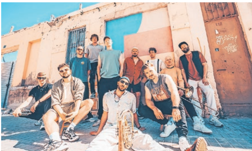
Die Gruppe „Querbeat“ bringt am Sonntagabend mit Brasspop die Bühne vorm Staatstheater zum Beben.