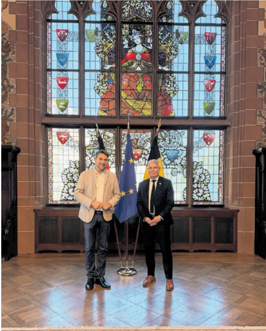
OB Conradt (l.) mit dem Minister der Regierung der Deutschsprachigen Gemeinschaft Ostbelgiens Gregor Freches im Rathausfestsaal.

Oberbürgermeister Uwe Conradt hat am Montag, 15. Juni, den Minister für Sport, Kultur, Tourismus und Medien der Regierung der Deutschsprachigen Gemeinschaft Ostbelgiens Gregor Freches und dessen Delegation im Rathaus St. Johann empfangen.