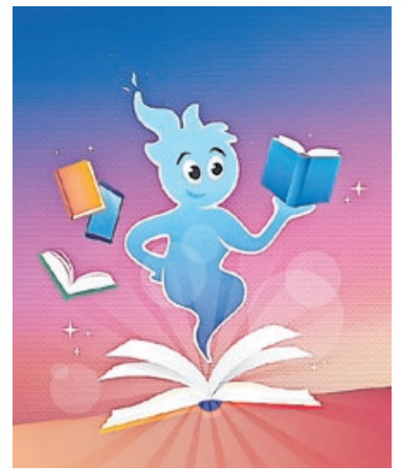
Lesesegeist „Lumis“ ist das Maskottchen des Lesesommers der Saarbrücker Stadtbibliothek. Grafik: Agentur Echtgut