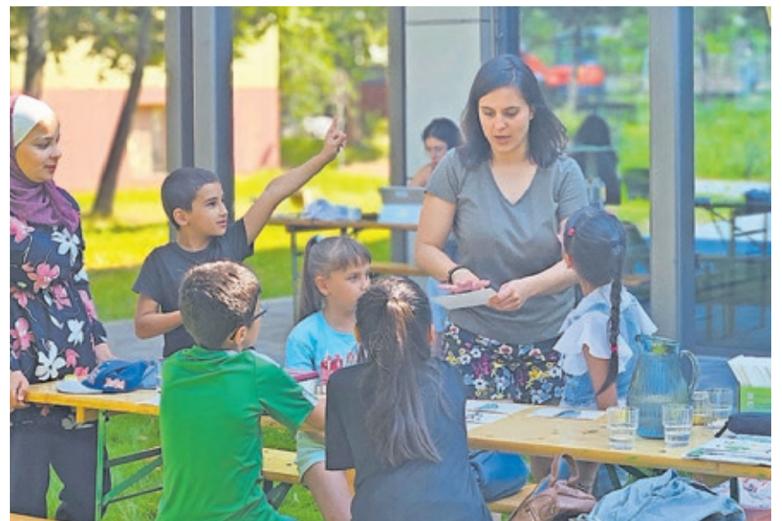
Im Sommer-Sprachcamp der Bildungswerkstatt Kirchberg lernen die Kinder in kleinen Gruppen, betreut von professionellen Sprachförderlehrkräften und Studierenden der Saar-Uni.

Bildungswerkstatt Kirchberg Kirchbergstraße 16, 66115 Saarbrücken Telefon: +49 681 905-6467 E-Mail: bildungswerkstatt@saarbruecken.de