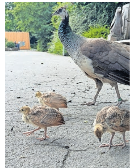
Die drei Pfauenküken im Saarbrücker Zoo folgen ihrer Mutter auf Schritt und Tritt.

Der Saarbrücker Zoo ist mit rund 200.000 Besucherinnen und Besuchern jährlich eine der größten Attraktionen des Saarlandes. Er beherbergt etwa 1.000 Tiere aus mehr als 100 Tierarten und engagiert sich in den Bereichen Artenschutz, Forschung und Umweltbildung. Der Zoo ist täglich geöffnet.