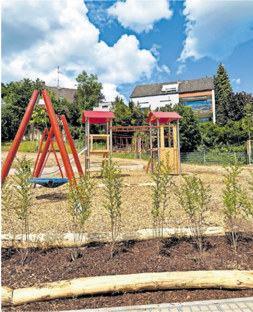
Kinder können auf dem Spielplatz „Im Kasental“ unter anderem rutschen und eine Nestkorbschaukel nutzen.