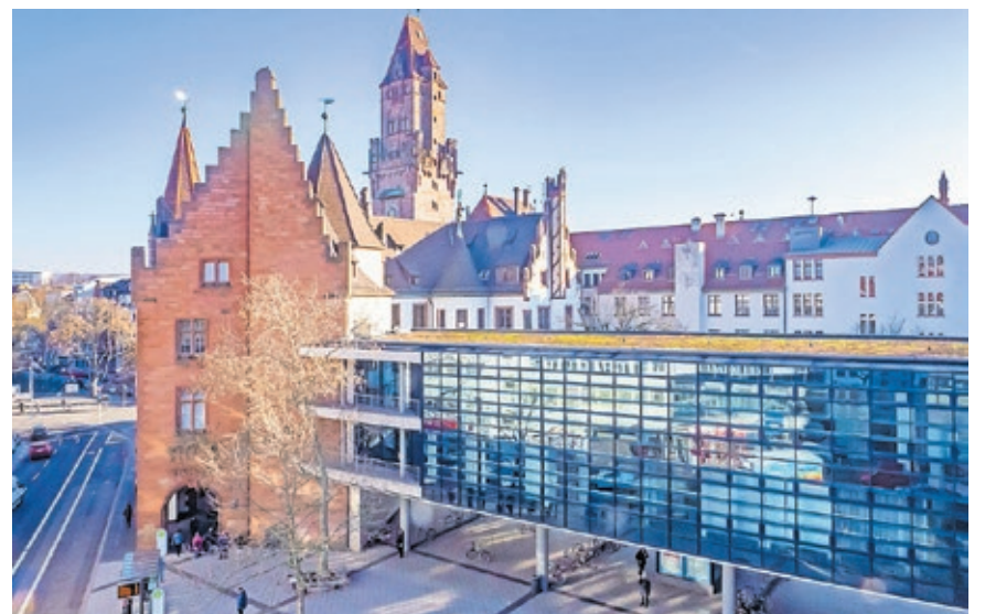
Ausweitung des Schnellservice-Angebots in den Saarbrücker Bürgerämtern.