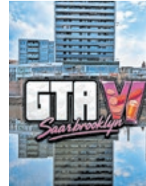
Melmut Frankhalter

ckern um das Schwenker-Monopol an, schmugelst eimerweise Melfor und lieferst Dir Verfolgungsjagden mit dem SBPD. Die unzähligen Baustellen sind kein Hindernis für Dich. Du steigst immer schneller in der Unterwelt auf, weshalb irgendwann der windige Baumogul Mario Welkovic auf Dich aufmerksam wird. Beim Vernichten mehrerer Kisten edelster Weine im Nobelschuppen Herfurth macht er Dir ein Angebot: Du sollst seine beim Bau des Fürstenpark-Stadions unterschlagenen Millionen waschen. Außerdem umtriebige Spaßpolitiker auf Abstand zu halten, die ihm angeblich auf den Fersen sind. Das große Finale steigt im nur verlassen wirkenden Pinguin Tower – dem heimlichen Zentrum der Stadt, wo beim mysteriösen Kon-Wue alle Fäden zusammenlaufen. Aber genug gespoilert.