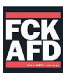
Melmut Frankhalter Foto: Die PARTEI

uns darum, extremistischen Parteien wie vor allem natürlich der fckafd den Zugang zu öffentlichen Räumlichkeiten für Wahlkampfveranstaltungen o.ä. zumindest zu erschweren. Das ist weder undemokratisch noch rechtsstaatlich fragwürdig. Bevor einer rumschreit. Das Gegenteil ist richtig: Demokratie und Rechtsstaat müssen verteidigt werden! Und wenn es die anderen nicht tun, dann eben wir. Wir beschwören keine Brandmauer, wir handeln! Wie brillant der Zeitpunkt gewählt war, zeigen die anstehenden Neuwahlen der Regionalversammlung und (wahrscheinlich) des Stadtrates – ausgelöst durch jeweils erfolgreiche Klagen der #fckafd. Extremisten machen sich den Rechtsstaat zunutze, wenn er ihnen hilft. Verhöhnern ihn aber, wenn sie sich den Regeln beugen müssen.