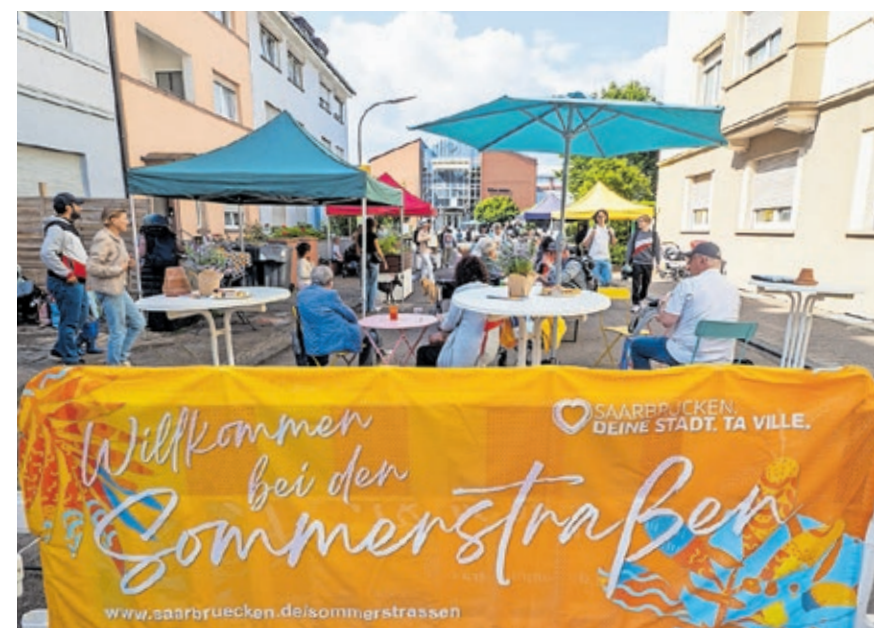
Im vergangenen Jahr wurden die Sommerstraßen in der Alvenslebenstraße eingerichtet.