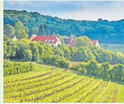
Der Wintringer Hof in Kleinblittersdorf bietet eine Vielfalt an regionalen landwirtschaftlichen Erzeugnissen.