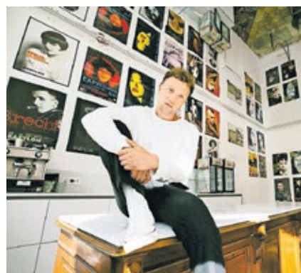
Der Singer/Songwriter Joris erobert als einer der Top Acts die Bühne vorm Staatstheater.