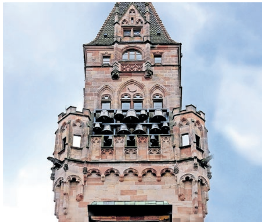
Zur Fête de la Musique bietet das Glockenspiel im Rathausurm ein Sonderrepertoire.