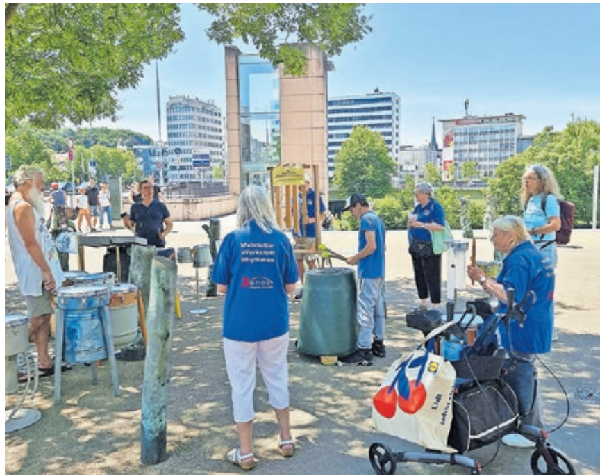
Die Musikgruppe „Malstatter Werkstatt Rhythmen“ trat im vergangenen Jahr bei der Fête de la Musique auf.

Nostalgisch wird es an der Tabaksmühle, wo das „Drehorgelduo“ um 15 Uhr sein Publikum mit Drehorgelmusik erfreut. In der Beachbar OneBeach an der Bismarckbrücke steht ab 16.30 Uhr mit