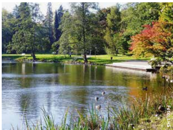
Deutschmühlenweiher im Deutsch-Französischen Garten

Cela ne signifie cependant pas qu’une correspondance soit disponible dès l’arrivée à l’arrêt en question, mais uniquement que la ligne et la ligne de correspondance partagent un arrêt commun.