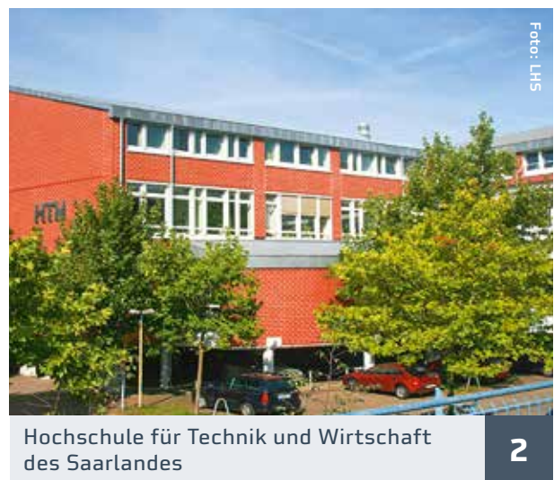
Hochschule für Technik und Wirtschaft des Saarlandes 2