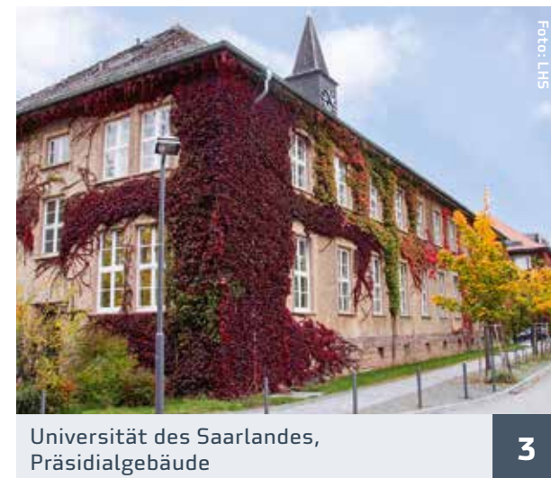
Universität des Saarlandes, Präsidialgebäude 3