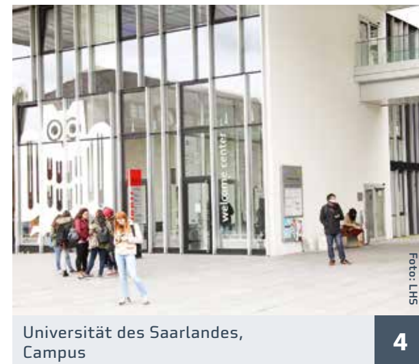
Universität des Saarlandes, Campus 4