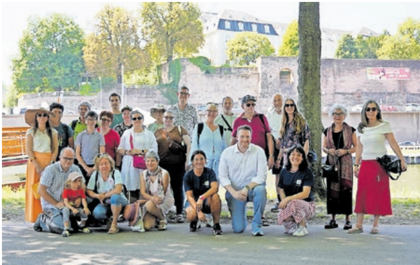
Sommerliche QuattroPole-Bürgerbegegnung in Saarbrücken.