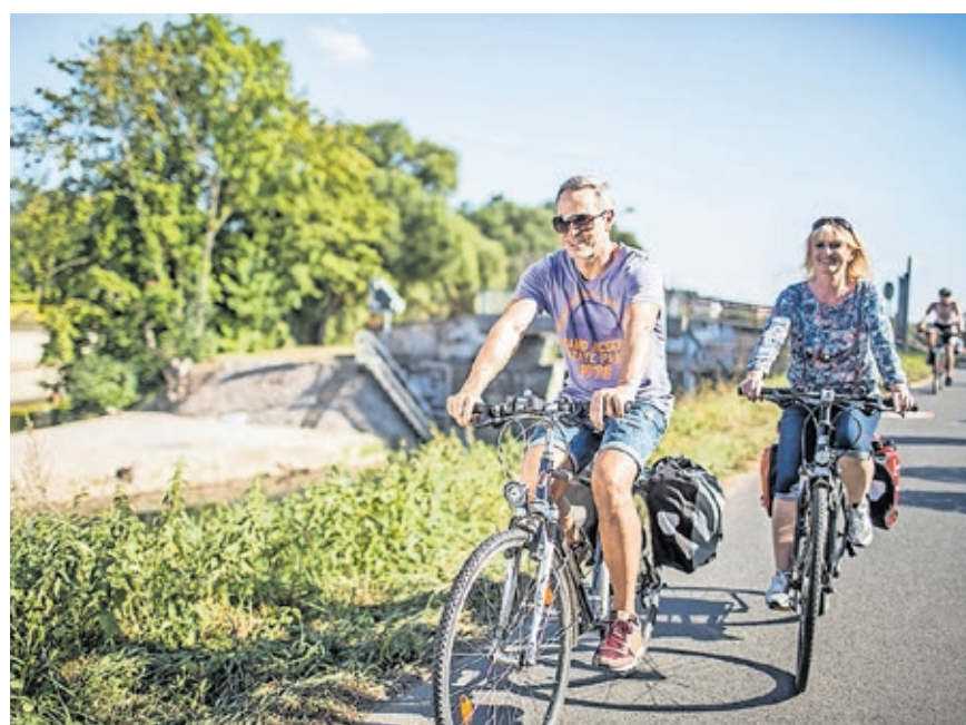
Beim „Stadtradeln“ zählt jeder mit dem Fahrrad zurückgelegte Kilometer, ob auf dem Weg zur Arbeit oder in der Freizeit.

Die Kampagne „Schulradeln“ wird auch dieses Jahr wieder zeitgleich mit dem „Stadtradeln“ durchgeführt. Schulen im Saarland treten in einer eigenen Kategorie an und setzen sich mit der Teilnahme am Wettbewerb ebenfalls für mehr Klimaschutz ein. Ziel der Aktion „Schulra-