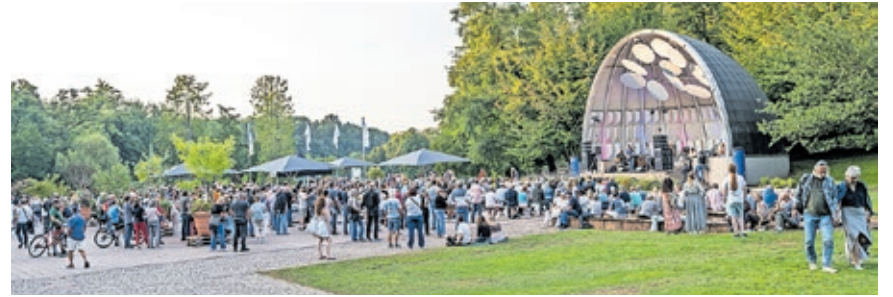
Live-Musik im Grünen gibt's auch diesen Sommer bei der Konzertreihe „Die Muschel rockt!“ im DFG.