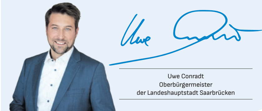
Uwe Conrath Oberbürgermeister der Landeshauptstadt Saarbrücken

Genießen Sie die vielfältigen Veranstaltungen in der Landeshauptstadt!