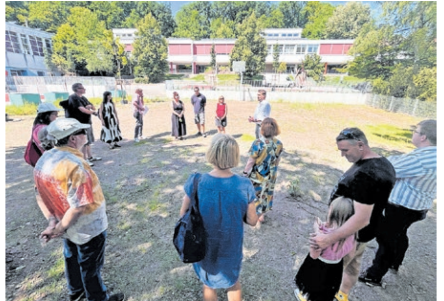
Bei der Sommertour 2025 war OB Conrard auch an der Freiwilligen Ganztagsgrundschule Herrensöhr unterwegs.

Oberbürgermeister Uwe Conrard geht auch in diesem Jahr wieder auf Sommertour in der Landeshauptstadt Saarbrücken.