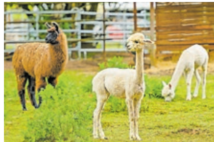
Die Saar Alpaka Farm zählt zu den Freizeit- und Erlebnisorten im Naherholungsgebiet Almet.