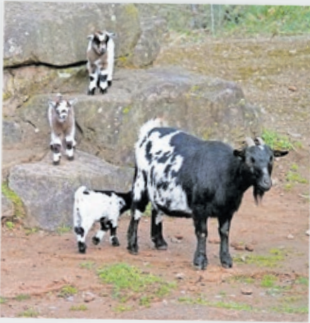
Besucherinnen und Besucher können die Mini-Zwergziegen im Streichelzoo aus der Nähe erleben.

Jetzt im Frühling gibt es im Saarbrücker Zoo wieder tierischen Nachwuchs zu entdecken. Bei mehreren Tierarten kamen in den vergangenen Monaten Jungtiere zur Welt. Entweder erkunden die Kleinen neugierig ihre neue Umgebung oder bleiben noch ganz nah bei ihren Eltern und der Gruppe. Für Besucherinnen und Besucher sind die niedlichen Tierbabys immer ein besonderer Blickfang. Hier gibt's ein paar Eindrücke.