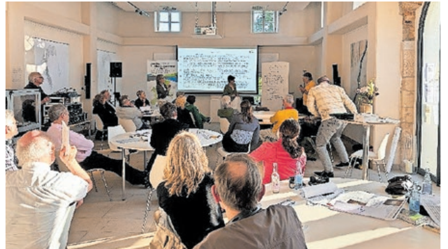
Der grenzüberschreitende Bürgerbeirat in der ersten Phase bei der Arbeit.

2022 hatte sich die Landeshauptstadt Saarbrücken zusammen mit dem Gemeindeverband Forbach sowie den zivilgesellschaftlichen Partnern Europ'age SaarLorLux e.V. und dem Entwicklungsbeirat des Gemeindeverbands Forbach im Rahmen von „Common