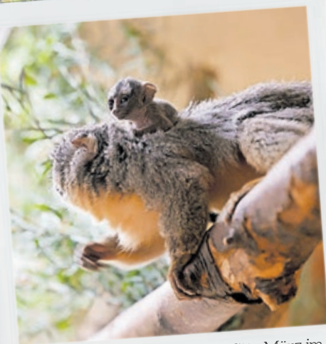
Der kleine Nachtaffe wurde Mitte März im Saarbrücker Zoo geboren.