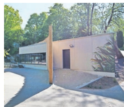
Der Neubau bietet mehr Platz, Rückzugsmöglichkeiten und Schutz für die Pinguine.

Der Saarbrücker Zoo ist mit rund 200.000 Besucherinnen und Besuchern jährlich eine der größten Attraktionen des Saarlandes. Er beherbergt etwa 1000 Tiere aus mehr als 100 Tierarten und engagiert sich in den Bereichen Artenschutz, Forschung und Umweltbildung. Der Zoo ist täglich geöffnet.