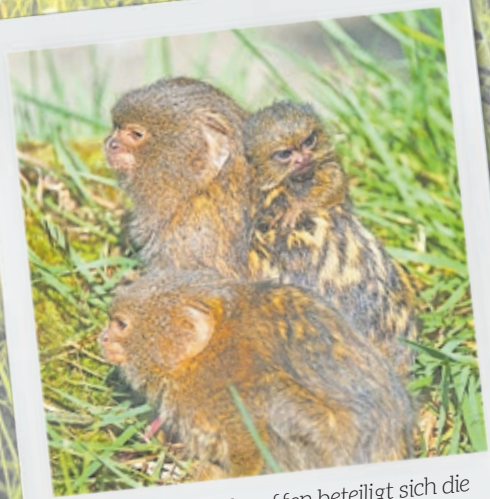
Bei den Zwergseidenaffen beteiligt sich die gesamte Gruppe an der Aufzucht des Nachwuchses.