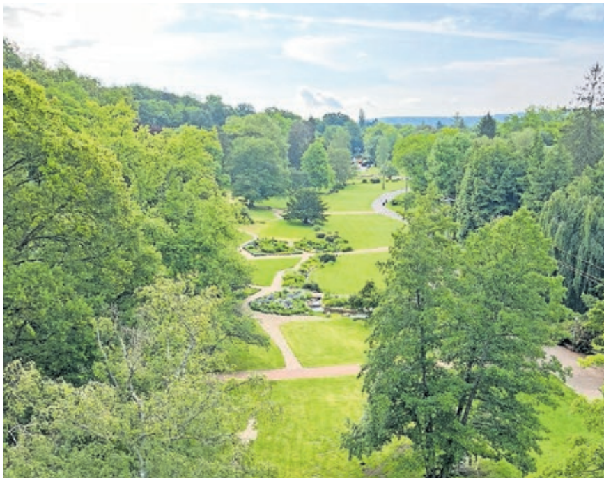
Blick ins Tal der Blumen im DFG.