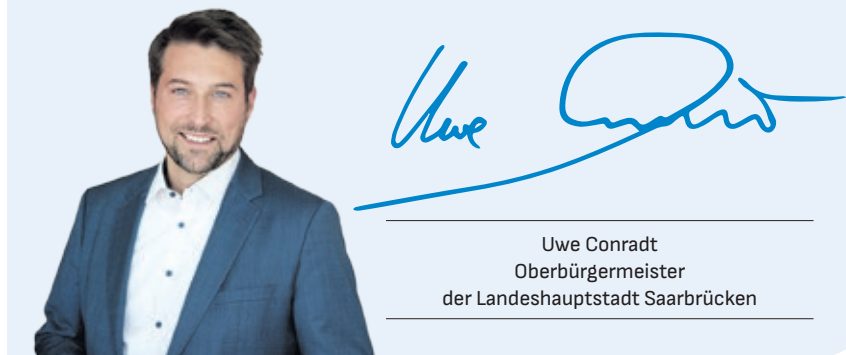
Uwe Conradt Oberbürgermeister der Landeshauptstadt Saarbrücken

Wir werden die technologieoffene Transformation in den Bereichen Mobilität, Energie und Wärme und unsere Projektpartnerschaften weiter ausbauen – mit dem klaren Ziel, Saarbrücken als führenden Innovationsstandort der Energiewende in der Großregion zu etablieren.