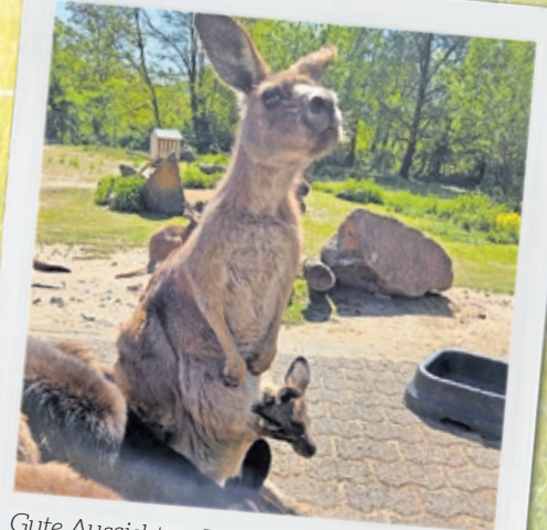
Gute Aussichten: Der Känguru-Nachwuchs entspannt im Beutel der Mama.