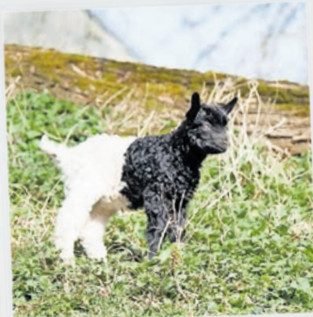
Der Walliser Schwarzhalsziegenbock ist das erste Jungtier dieser Art im Saarbrücker Zoo seit 2012.