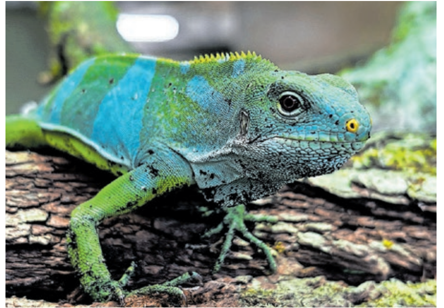
Die Fidschileguane sind ein Blickfang im Tropikarium.

Das Tropikarium beherbergt jetzt eine Gruppe Baumhöhlen-Krötenlaubfrösche. Die Tiere stammen aus dem NaturZoo Rheine. Ein Männchen und zwei Weibchen teilen sich das Terrarium mit Riesenblattschrecken. Die Baumhöhlen-Krötenlaubfrösche sind in den Regenwaldregionen Südamerikas beheimatet und benötigen dauerhaft hohe Luftfeuchtigkeit. Für die neue Tiergruppe hat der Zoo das Terrarium entsprechend angepasst und mit Moos, einer