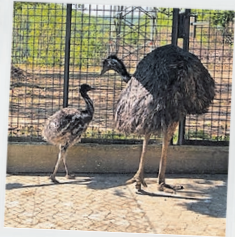
Bei den Emus übernimmt das Männchen die Brut und Aufzucht des Jungtiers.