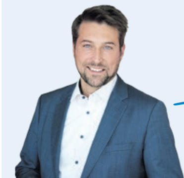
Uwe Conradt Oberbürgermeister der Landeshauptstadt Saarbrücken

Es lohnt sich auch immer, die Angebote unseres Referats „Kinder in der Stadt“, kurz: KidS, im Auge zu behalten. Dieses Jahr haben die Kolleginnen und Kollegen für Kinder unter dem Motto „Entdecke deine Stadt“ viele spannende Aktionen gesammelt. Ein paar stehen noch aus: zum Beispiel ein Erste Hilfe-Schnupperkurs im Kultur- und Lesetreff St. Arnual und ein Tanzworkshop im Bürgerpark Dudweiler.