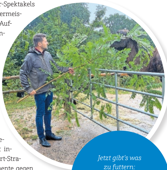
Jetzt gibt's was zu futtern: Im Zoo hat der Oberbürgermeister unter anderem bei der Fütterung der Tiere geholfen