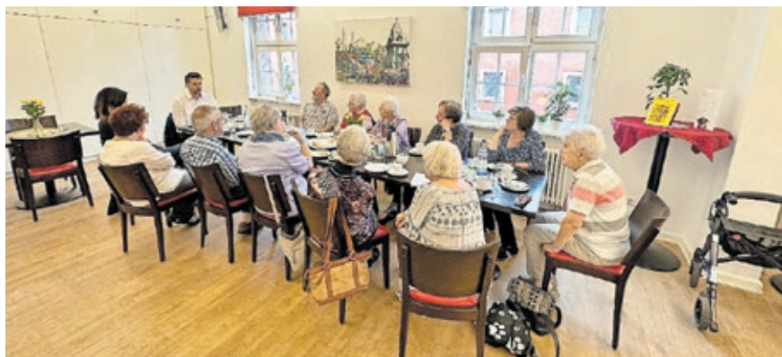
In Brebach hat sich der Oberbürgermeister zum Waffelkaffee mit Seniorinnen und Senioren getroffen und sich über deren Anliegen mit ihnen ausgetauscht.