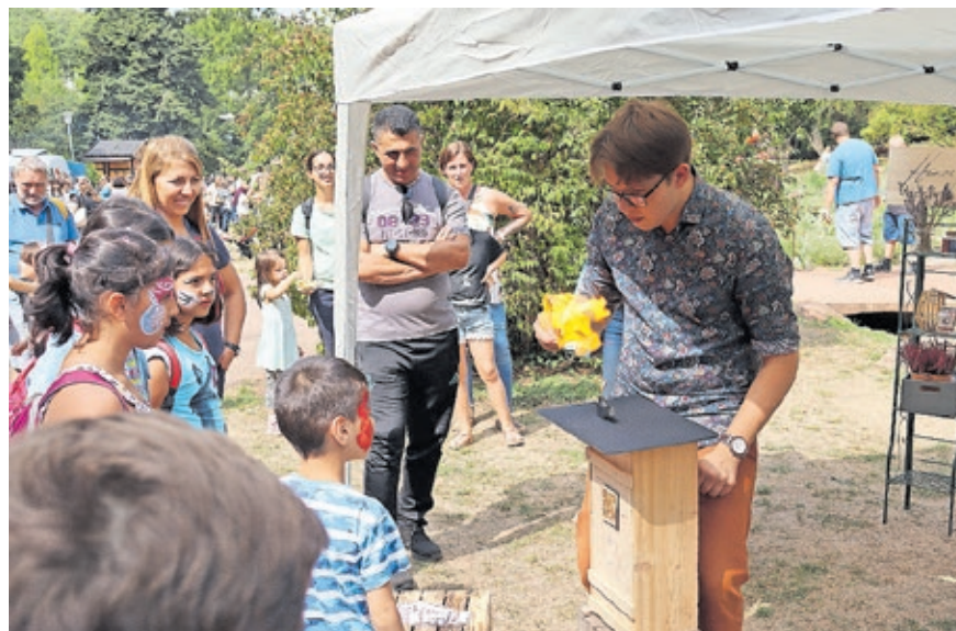
Ein Zauberer präsentiert Kindern und ihren Eltern seine Tricks im Deutsch-Französischen Garten.