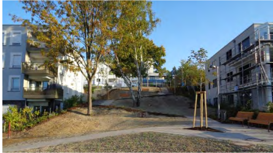
Grünanlage Schlesienring, Eschberg