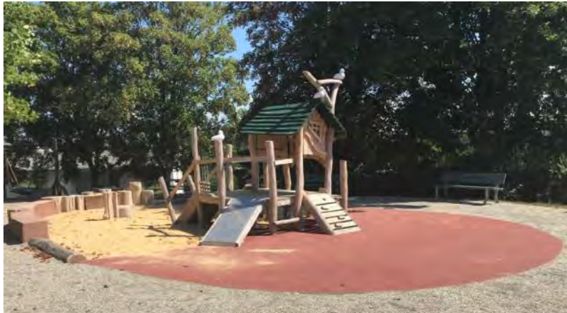
Kinderspielplatz „Auf Gierspel“