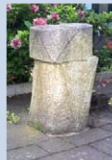
Skulptur von Hiroshi Mikami (Japan) im Innenhof der Musikhochschule

Gestaltung: Öffentlichkeitsarbeit/Agentur