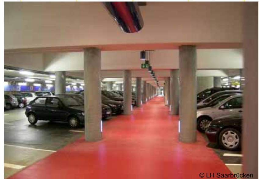
Neue Parkgarage unter Boulevard