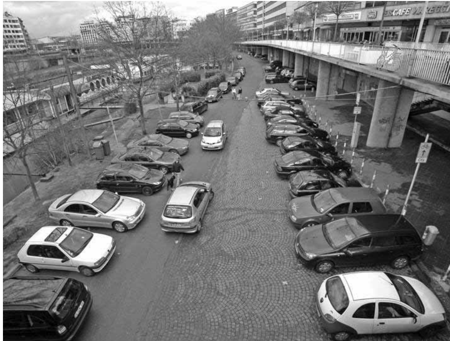
Berliner Promenade heute

Potentiale für Tourismus, Kultur, Einzelhandel ausbauen und vernetzen