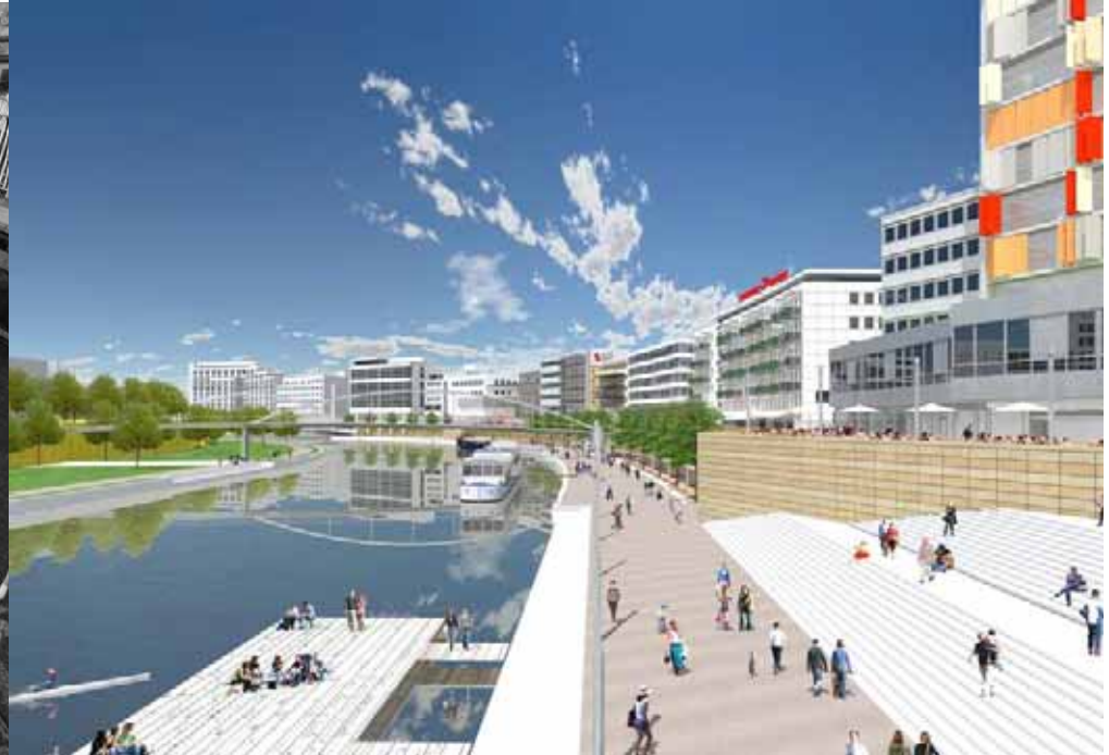
Berliner Promenade 2011